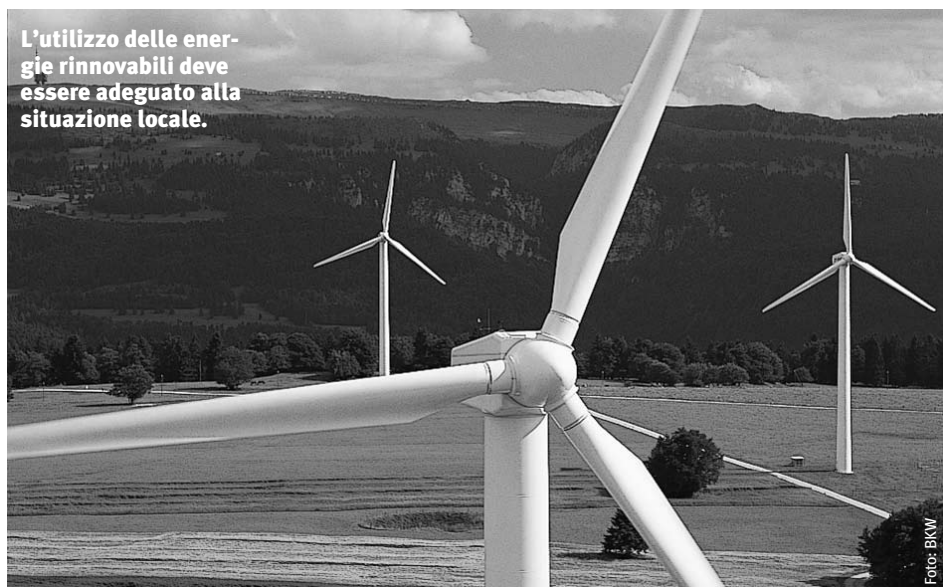
L'utilizzo delle energie rinnovabili deve essere adeguato alla situazione locale.

«Bioenergieregion Goms» (Canton Vallese) e «Potentiel bois-énergie en pâturage boisé» (Canton Neuchâtel)