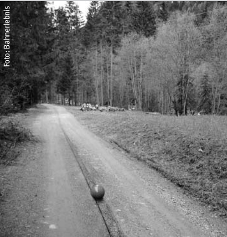
La sfera apre la strada.