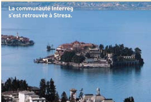
La communauté Interreg s'est retrouvée à Stresa.

Près de 380 acteurs Interreg de toute l'Europe se sont retrouvés les 19 et 20 juin 2006 à Stresa (Italie) pour un échange d'expériences. Dénommée «Alpine Space Summit», cette rencontre a permis de transmettre et d'évaluer les expériences acquises dans le cadre du programme Interreg IIIB. Dans le cadre de l'exposition des projets en parallèle de la manifestation, les participants ont eu la possibilité de découvrir de nombreuses installations et présentations partiellement en couleurs et pleines d'imagination. Les organisateurs s'apprêtent d'ailleurs à publier les résultats de la manifestation. Une brochure paraîtra prochainement sur le sujet. Pour d'autres informations sur «Alpine Space Summit», consulter le site Internet www.alpinespace.org/172.html .