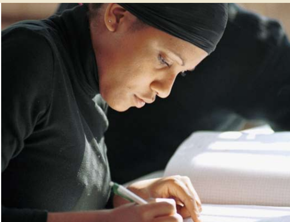
Toujours plus de gens se forment à domicile

L es études dans les universités et autres hautes écoles peuvent aujourd'hui être suivies à distance dans différents domaines spécialisés. La Fondation pour la Formation à distance Suisse et la Fernfachhochschule Brigue sont les pionniers en la matière. Dans le cadre du projet transfrontalier «Etudier et travailler», leurs responsables ont ouvert un Centre de formation à distance en coopération avec et dans les locaux mêmes du Collegio Rosmini à Domodossola. Le projet est soutenu par la région Brigue-Aletsch, la Fondation pour la Formation à distance Suisse 2003 et par les cinq communes de la vallée italienne d'Ossola (Comunità Montana Valle Ossola). L'objectif des partenaires est de renforcer l'offre en matière de formation à distance dans la région et de la développer de manière coordonnée. Ils souhaitent également encourager la population indigène à profiter davantage de cette offre.