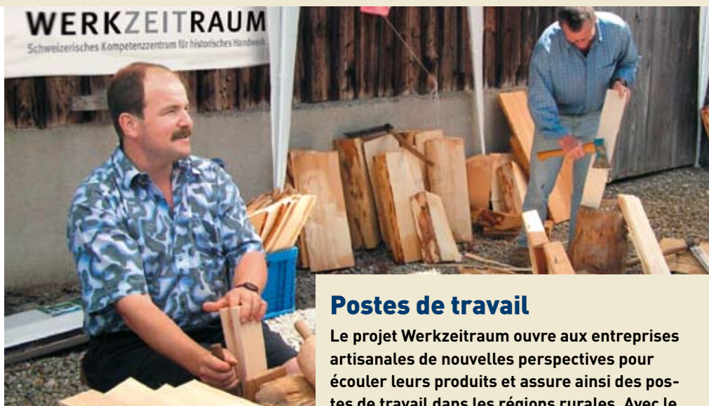
Le bois joue un rôle prépondérant dans l'artisanat traditionnel.