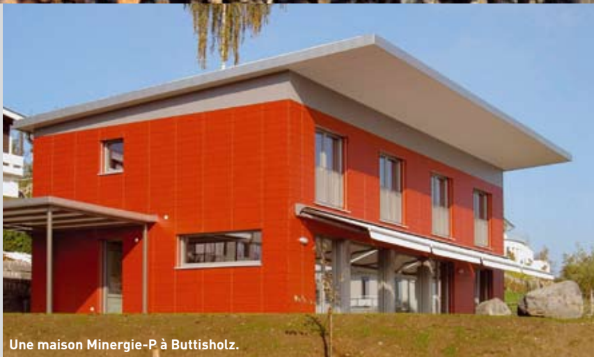
Une maison Minergie-P à Buttisholz.