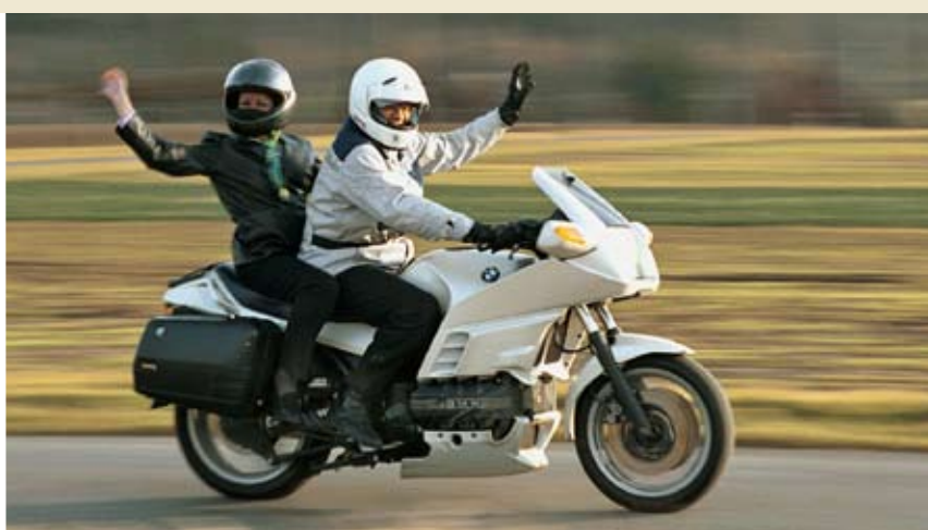
Un groupe cible intéressant sur le plan économique: les motards en randonnée

Le thème à l'ordre du jour de la convention de 2005 à Deggendorf était centré sur l'économie. Au cours de différents ateliers de travail, les participants ont échangé leurs expériences et abordé des sujets tels que les constructions en bois, l'énergie et l'environnement. Ils ont ainsi rassemblé des idées pour