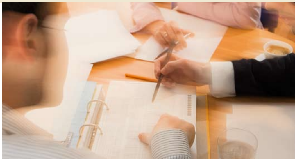
Des représentants de PME développent de nouveaux concepts de marketing.

Dans une première phase du projet, les enseignants de la Haute école professionnelle de Suisse centrale ont pris contact avec les PME de la région et ont rendu visite aux dirigeants des entrepri-