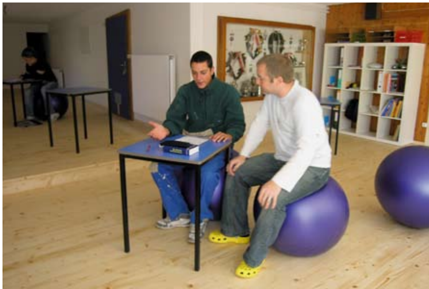
La formation théorique fait partie du séjour à Gadmen.

gens ayant cherché en vain une place d'apprentissage. Cinq jeunes y travaillent actuellement. Ils devraient être une quinzaine d'ici environ deux ans et sont encadrés par des spécialistes socio-pédagogiques. L'équipe est complétée par des professionnels du secteur gastronomique ou artisanal en général. L'objectif des initiateurs du projet est de créer un réseau régional