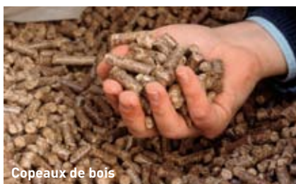
Copeaux de bois

La branche suisse du bois a développé l'un des secteurs les plus innovateurs de ces dernières années. De nouveaux produits, normes et concepts de construction contribuent à rendre le bois de plus en plus attractif et de plus en plus demandé. Ainsi, par exemple, les dernières règles de protection anti-feu en vigueur depuis début 2005 offrent des perspectives encourageantes aux constructions en bois sur plusieurs étages. Dans le cadre du projet ENA, les partenaires cherchent de nouvelles formes de coopérations dans cette chaîne de plus-value du bois. De nouvelles possibilités de certifications, de cours ainsi qu'un marketing transnational plus pointu peuvent favoriser la vente du bois comme matériau de construction ou comme combustible. Les PME actives dans la branche du bois contribuent également de manière significative à la stabilité du marché de l'emploi.