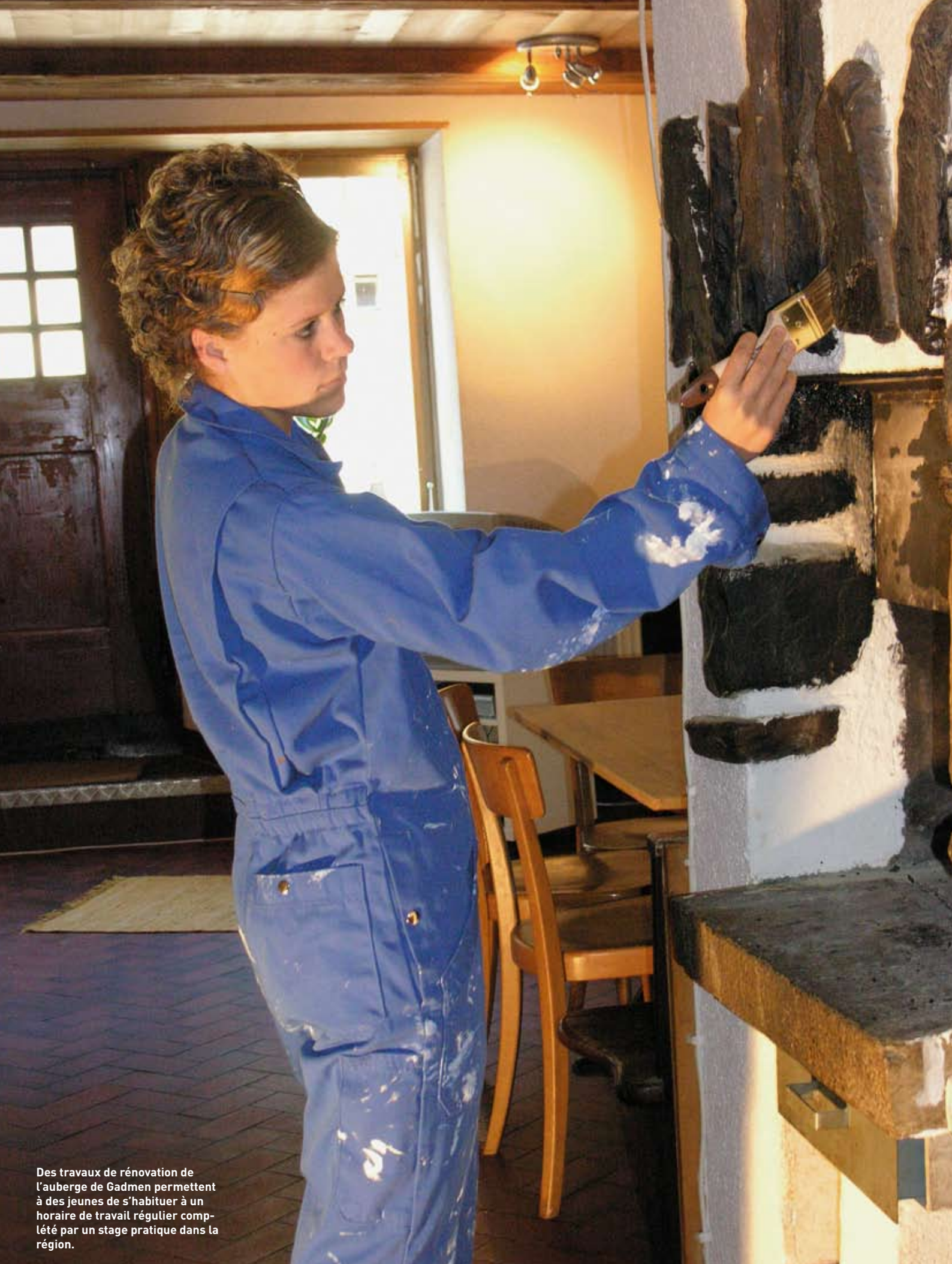
Des travaux de rénovation de l'auberge de Gadmen permettent à des jeunes de s'habituer à un horaire de travail régulier complété par un stage pratique dans la région.