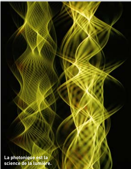
La photonique est la science de la lumière.