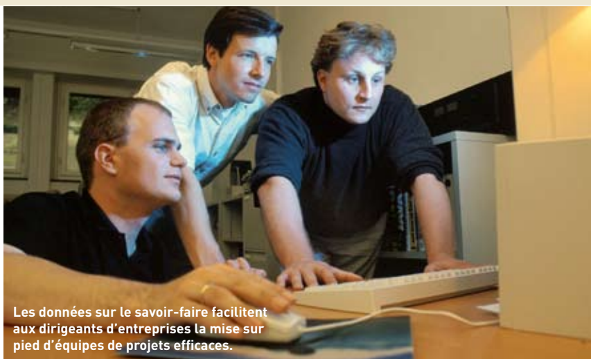
Les données sur le savoir-faire facilitent aux dirigeants d'entreprises la mise sur pied d'équipes de projets efficaces.

L'idée est certainement pertinente, mais les PME cherchent en vain pour l'instant des solutions similaires. Le développement et l'exploitation d'une ban-